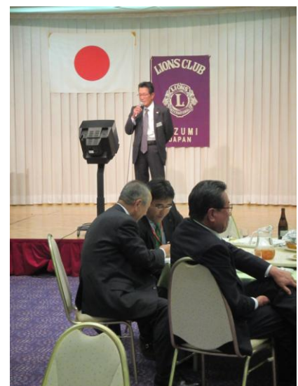
【クラブ対抗歌合戦、