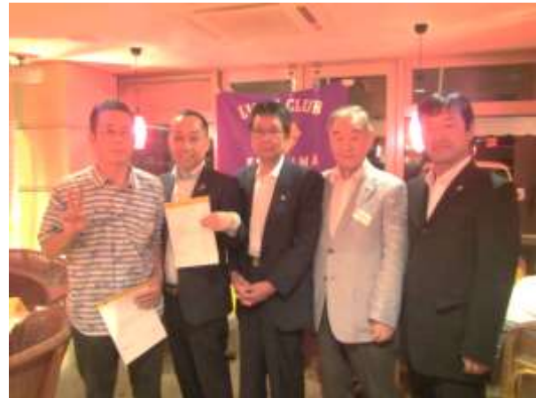
[2015～2016年度モナーク・シェブロン受賞者]