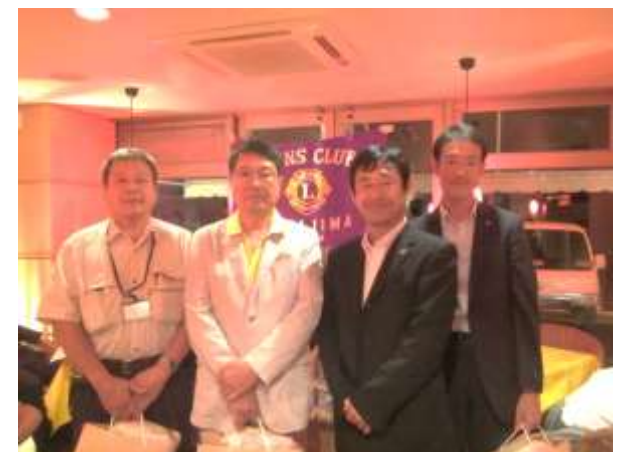
[10月生まれの皆様、おめでとうございます!]