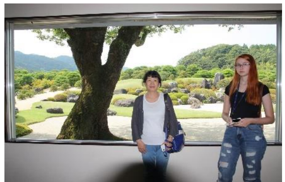
足立美術館にて奥様とサラさん