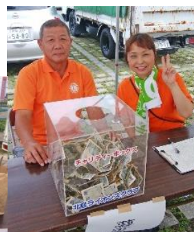
沢山集まった募金↑