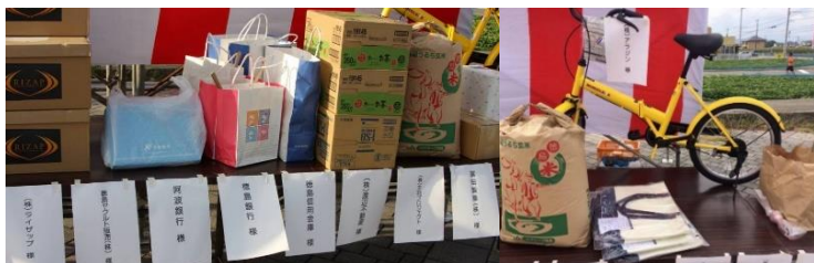
協賛企業35社よりの提供商品↑

この素晴らしいイベントが続きますよう皆様よろしくお願い致します。本当にありがとうございました。