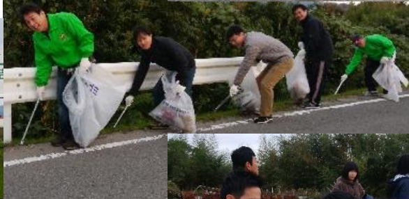
→ 徳島銀行様ご協力中