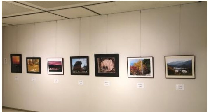
北島町文化祭 展示↑

機会があれば作品をご覧ください。写真に興味のある方のご入会もお待ちしております。