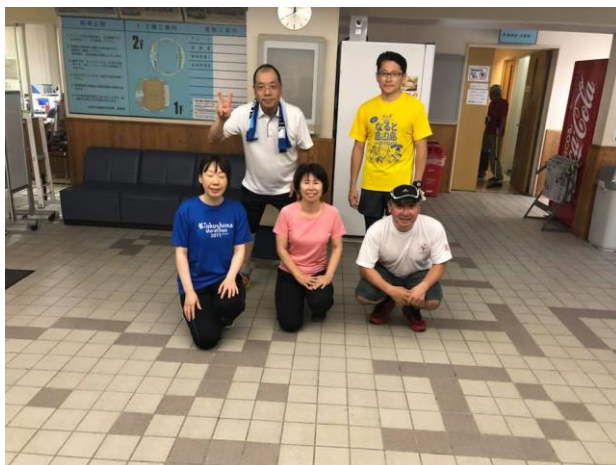
← 6月27日(水)の合同練習 日中の猛暑が冷めないまま、練習がスタート！ 暑さに負けず、楽しくランニング出来ました。 ←