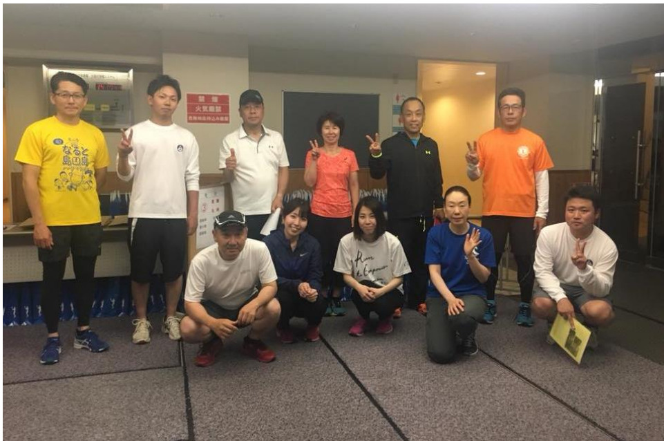
6月13日(水)の合同練習 ↑ 涼しいくらいの風の中、のんびりと走りました。