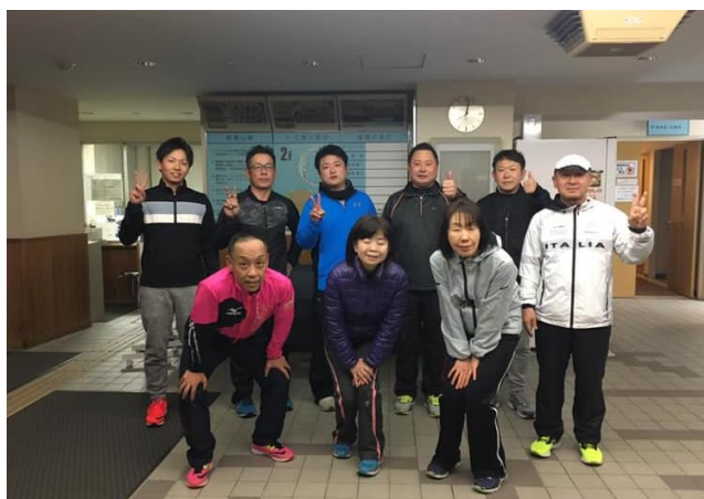
1月16日(水)の合同練習↑