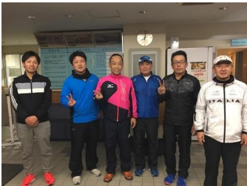
1月23日(水)の合同練習↑

マラソン同好会では、毎週水曜日19時からサンフラワードーム(北島北公園総合体育館)に集合して合同練習をしています。2月3日(日)の第73回香川丸亀国際ハーフマラソン・3月17日(日)のとくしまマラソン2019に向け練習に励んでいます。応援よろしくお願いいたします。