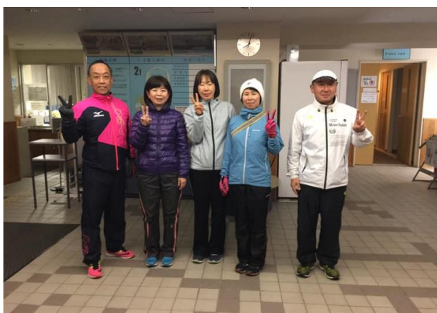
1月9日(水) 今年に入り初めての合同練習↑