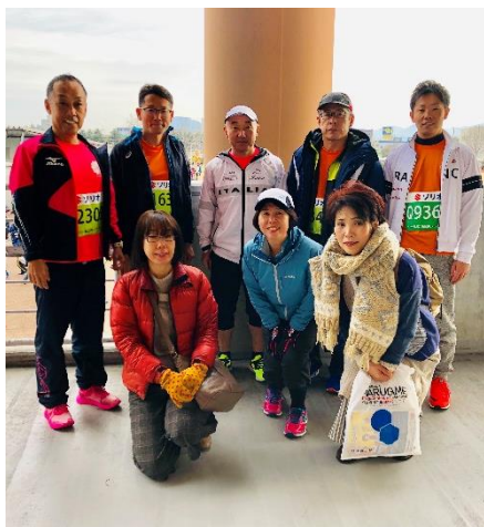
香川丸亀国際ハーフマラソン