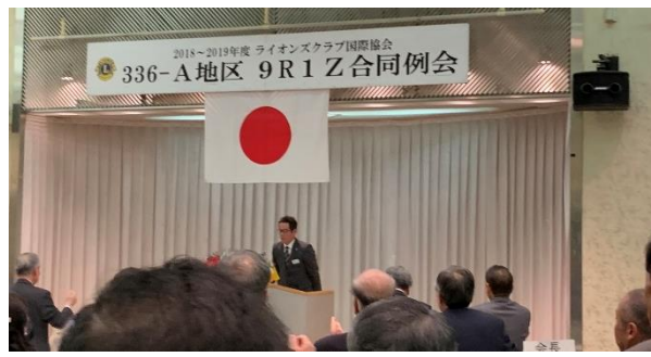
角元会長あいさつ↑