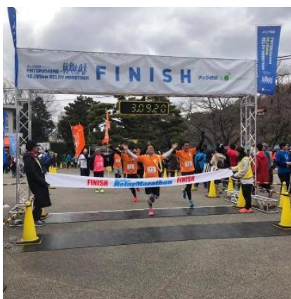
リレーマラソン ゴールの様子