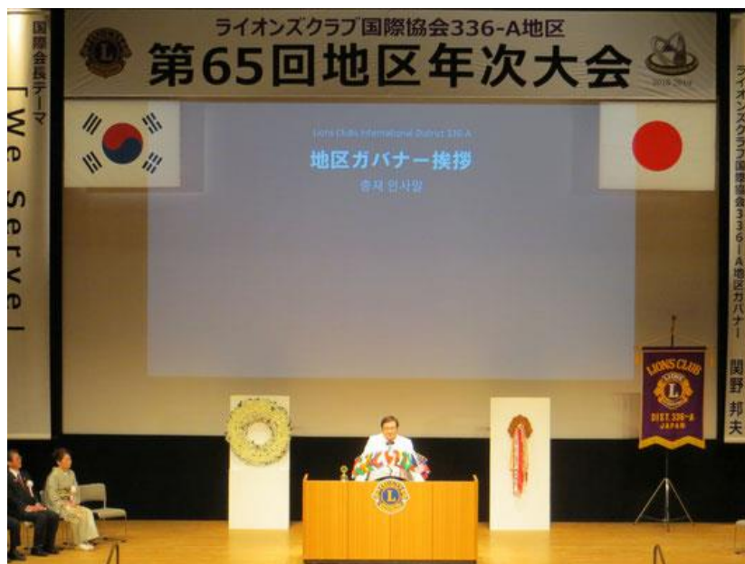
『第65回地区年次大会』

4月7日(日)336-A地区「第65回地区年次大会」が西条市総合文化会館にて開催されました。午前中の代議員分科会及び総会で、今期の事業報告などを行い午後から式典が行われました。アワードにおいてわが北島LCは、 ライオンズ情報特別賞、平和ポスター賞銀賞、救援対策部門賞優秀賞、IT推進賞優秀賞、同好会優秀賞 の 5部門 で受賞しました。