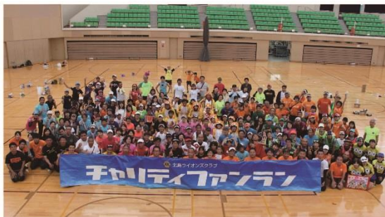
2019.09.21 チャリティファンラン in サンフラワードーム 報告書

大会運営にご協力頂いた全ての皆様に感謝を申し上げるとともに、この素晴らしいイベントが今後も続けられたらと思っております。