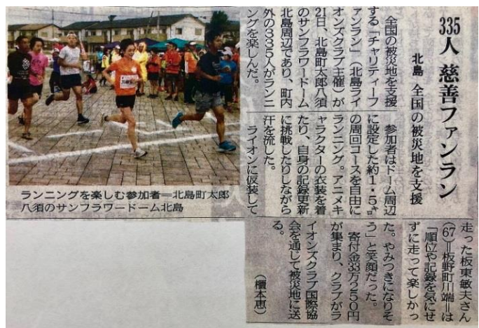
徳島新聞 9/22 掲載↑