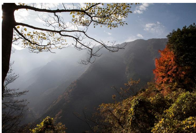
江富 久雄氏 作品