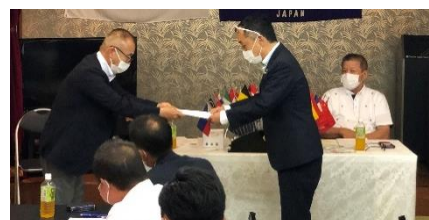
地区ガバナー感謝状授与↑